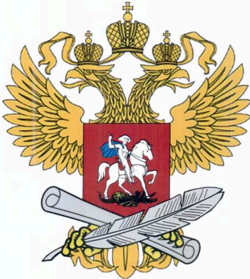
Рисунок геральдического знака – малой эмблемы Министерства образования и науки Российской Федерации